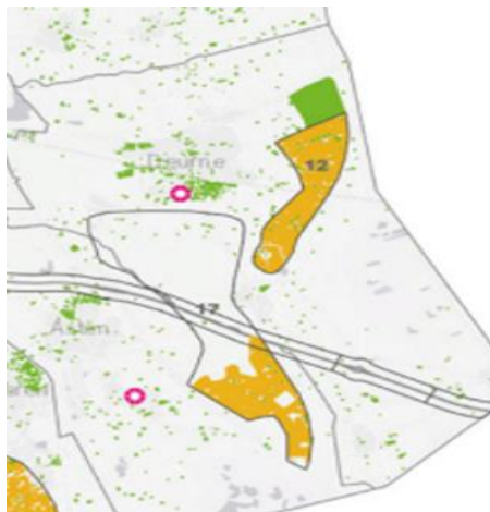
Figuur 2. Zoekgebieden RES in Deurne

Na consultatie van inwoners en stakeholders heeft de gemeente alleen zoekgebied 12 en het glastuinbouwgebied gebied (No Regret) aangedragen om op te nemen in RES 1.0. Daarnaast heeft de gemeente het Manifest Klimaatcorridor A67 getekend (zie figuur 2).